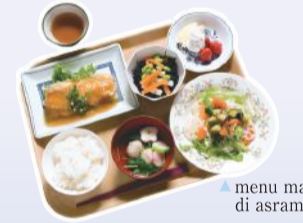
menu makan di asrama