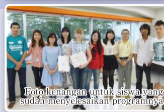
Foto kenangan untuk siswa yang sudah menyelesaikan programnya