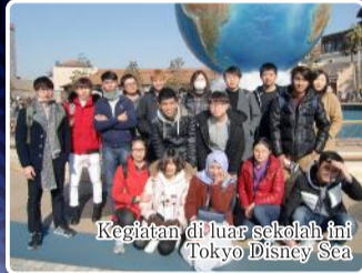
Kegiatan di luar sekolah ini Tokyo Disney Sea