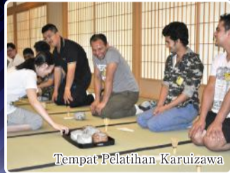
Tempat Pelatihan Karuizawa