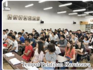
Tempat Pelatihan Karuizawa