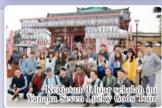
Kegiatan di luar sekolah ini Yanaka Seven Lucky Gods Tour