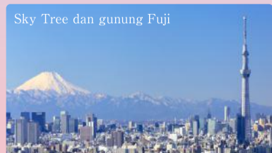
Sky Tree dan gunung Fuji