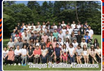
Tempat Pelatihan Karuizawa