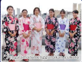
Pengalaman menggunakan yukata