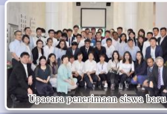
Upacara penerimaan siswa baru