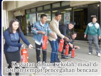
Kegiatan di luar sekolah, misal di latihan tempat pencegahan bencana