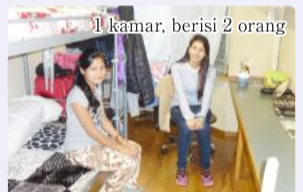
1 kamar, berisi 2 orang