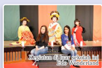
Kegiatan di luar sekolah ini Edo Wonderland